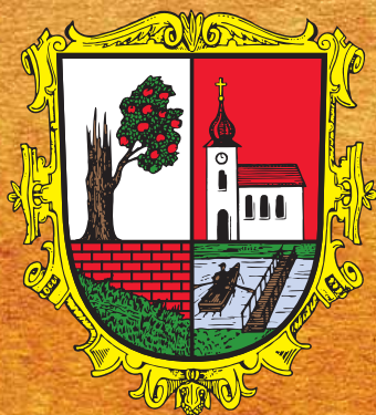
Město Jablonec nad Jizerou

Všichni občané Jablonce nad Jizerou jsou k účasti na oslavách srdečně zváni. Pojďte společně slavit, buďte u toho.