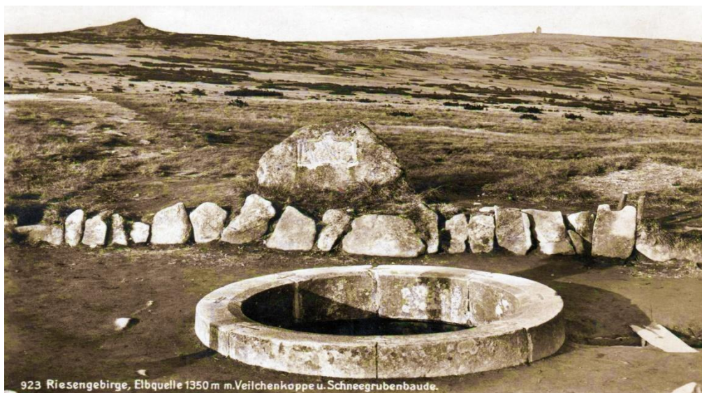
923 Riesengebirge, Elbquelle 1350 m.Veilchenkoppe u.Schnee grubenbaude.